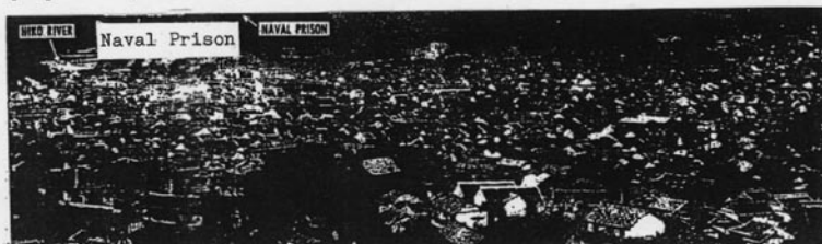
PHOTO 1—Kure City—Northern part of city showing the unusually high degree of housing congestion in the Zone 1 fire area. View has been retouched to obliterate buildings of Kure Naval Prison.

Their planes were shot down, but survived the crash and detained in the Naval Prison. They all returned home after the War, having survived American air raid on July 1/2, 1945, which bombed with "Best Effort" by 141 B-29s (16,681 incendiary napalm bombs) targeting the most vulnerable "Incendiary Zone No.1 in Kure in the same manner the Atomic bomb targeted "Fire Zone No.1" in Hiroshima. The "Incendiary Zone No.1 of Kure was close to the area where the Naval Prison was situated, shown in the photo, prepared by U.S. Target Information Center.